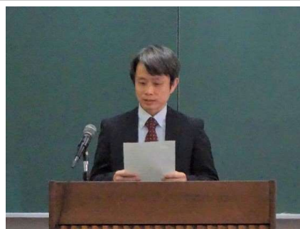
政策研究大学院大学 防災政策(DMP)プログラムディレクター 菅原 賢教授