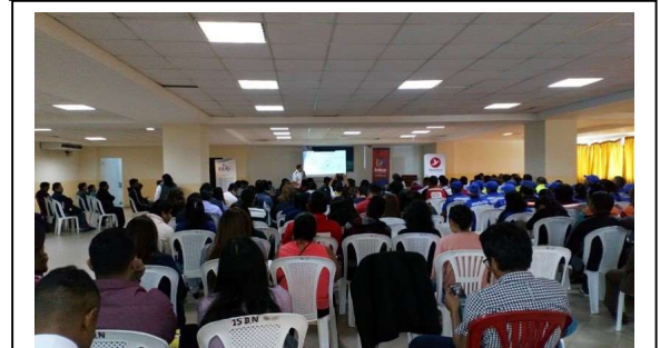
BJE 地域セミナー 200名以上が参加