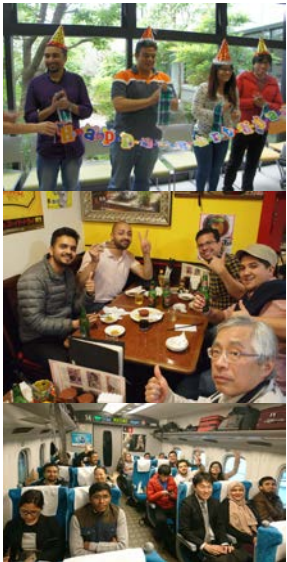
楽しむのは今です。