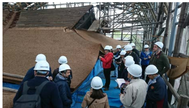
東寺御影堂保存修理現場