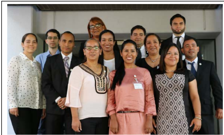
2018年中南米研修の研修生