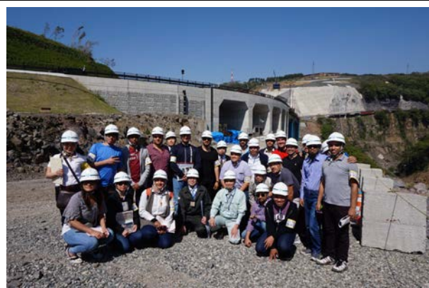
阿蘇大橋地区復旧工事現場