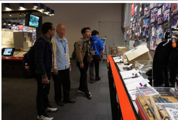
人と防災未来センター