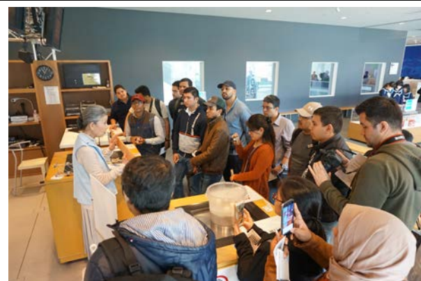
人と防災未来センター