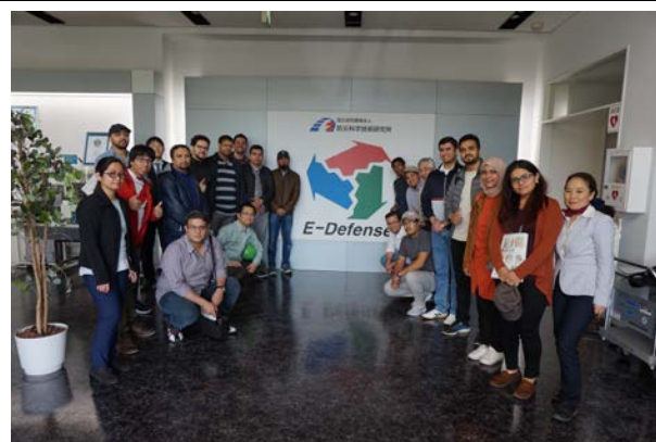
防災科学技術研究所 兵庫耐震工学研究センター