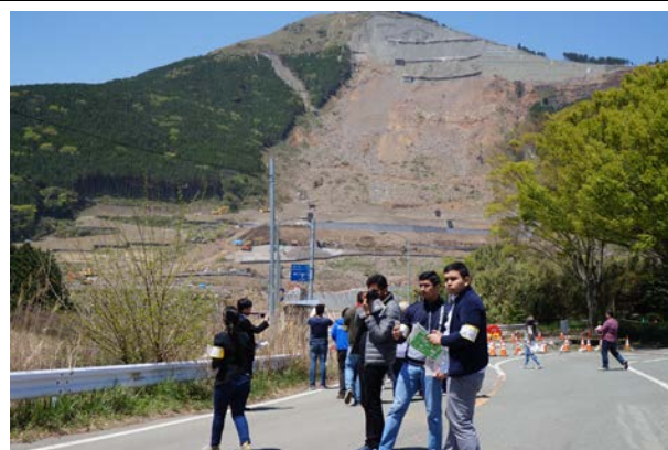
阿蘇大橋崩落現場付近