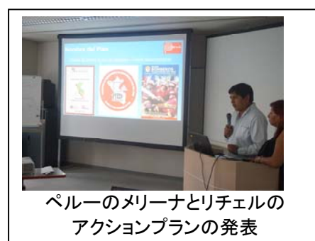
ペルーのメリーナとリチェルの アクションプランの発表

7月7日(木)は、中南米研修の研修生やIISEEにとって、もりだくさんの1日でした。朝から中南米研修の研修生によるアクションプランの発表がIISEEにて行われ、15時30分まで続きました。終了後、食堂にてIISEEが企画した親善パーティーが開催されました。発表で緊張していた研修生も、おいしいお菓子と和やかな雰囲気の中、リラックスした様子でした。