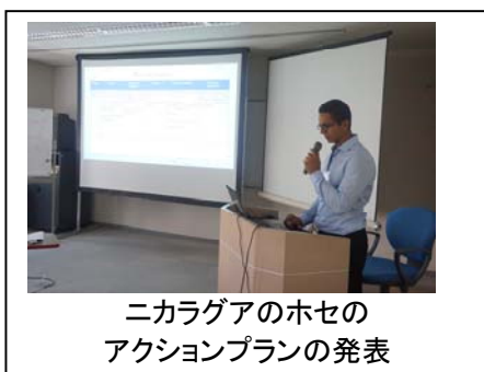
ニカラグアのホセの アクションプランの発表