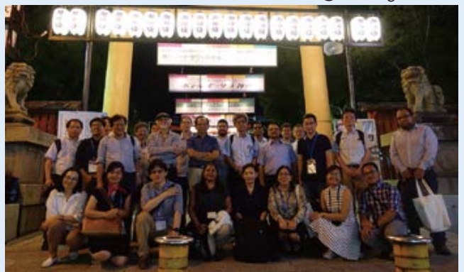
IAG-IASPEI 2017@Kobe, Japan