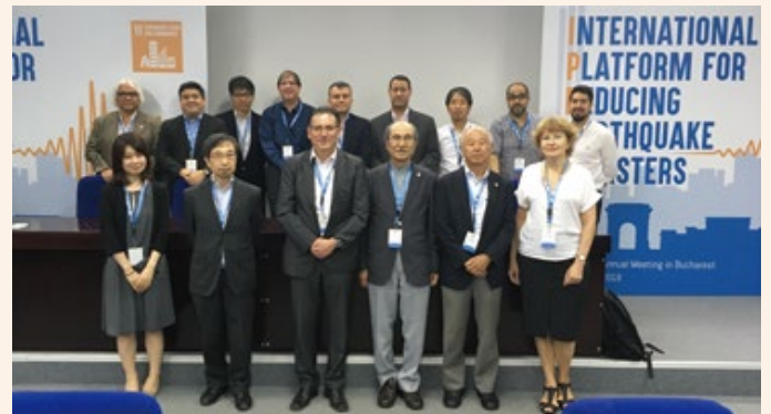
ルーマニア・ブカレストでの会合（2019 年 6 月）